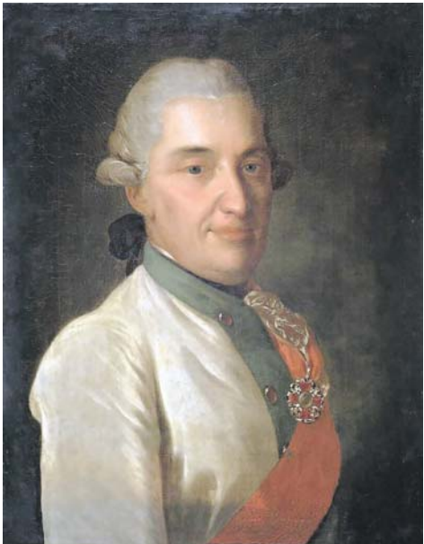
Художник Федор Степанович Рокотов. 1770-е годы. Адмирал Алексей Наумович Сенявин (1722–1797)