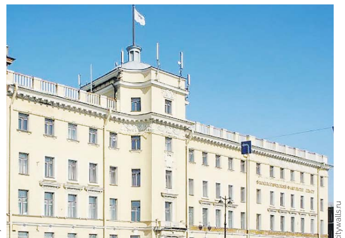
Наб. Лейтенанта Шмидта, 11 / 9-я линия, 2 / Кадетский пер., 2