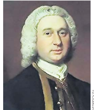
Наум Акимович Синявин (1680–1738)

Среди братьев Сенявиных были не только государственные служащие, но и морские офицеры. В отличие от старших — Ивана и Ульяна — Наум Акимович не попал в состав Великого посольства, а приобретал мореходные знания на русских военных судах. Он стал первым русским вице-адмиралом.