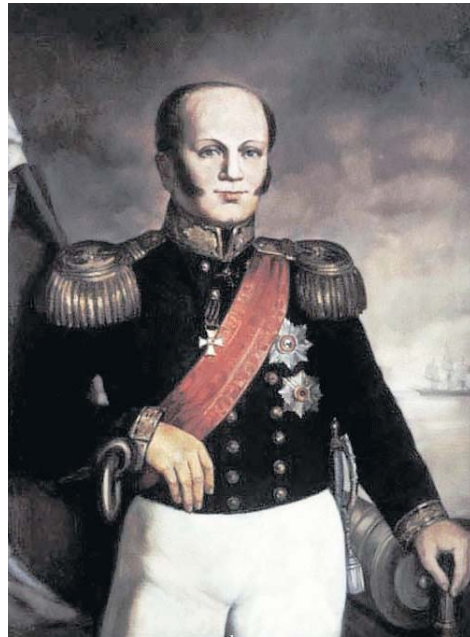
Адмирал Дмитрий Николаевич Сенявин (1763–1831)

но-морскую кампанию был оценен по достоинству: в 1775 году Алексей Наумович получил звание адмирала.