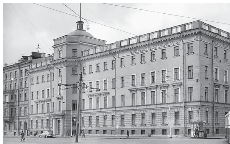
Наб. Лейтенанта Шмидта, 1967 год