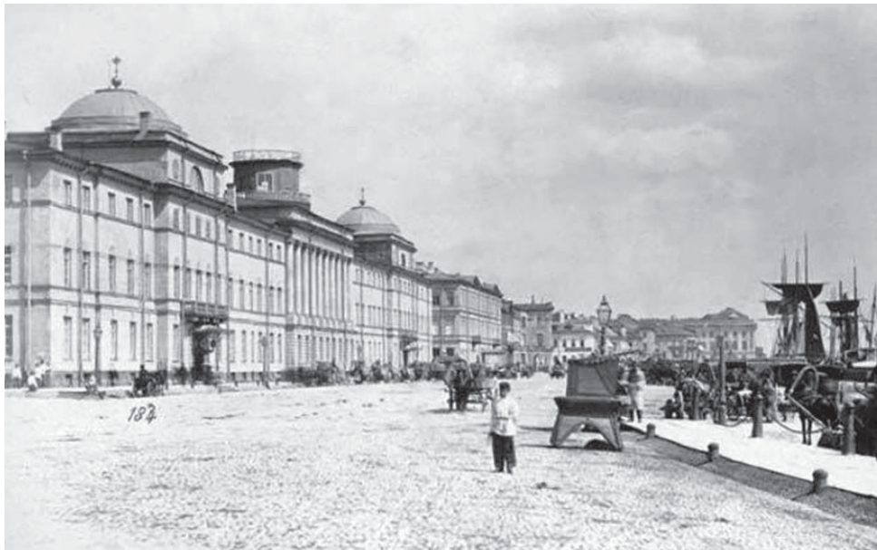
Морской корпус. 1870-е годы

В нашем городе имя Крылова носит один из крупнейших мировых исследовательских центров в области кораблестроения и проектирования — Крыловский государственный научный центр. Рядом с Военно-морской академией проходит улица Академика Крылова. Две значимые премии (Академии наук и Правительства Санкт-Петербурга) названы именем ученого.