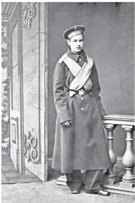
Курсант Морского училища Алексей Крылов в 1882 году