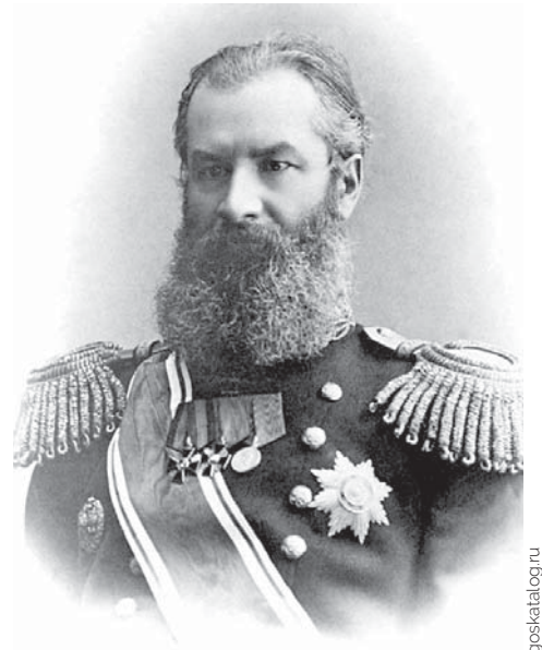
Генерал-майор по Адмиралтейству Алексей Николаевич Крылов

В нашем городе имя Крылова носит один из крупнейших мировых исследовательских центров в области кораблестроения и проектирования — Крыловский государственный научный центр. Рядом с Военно-морской академией проходит улица Академика Крылова. Две значимые премии (Академии наук и Правительства Санкт-Петербурга) названы именем ученого.