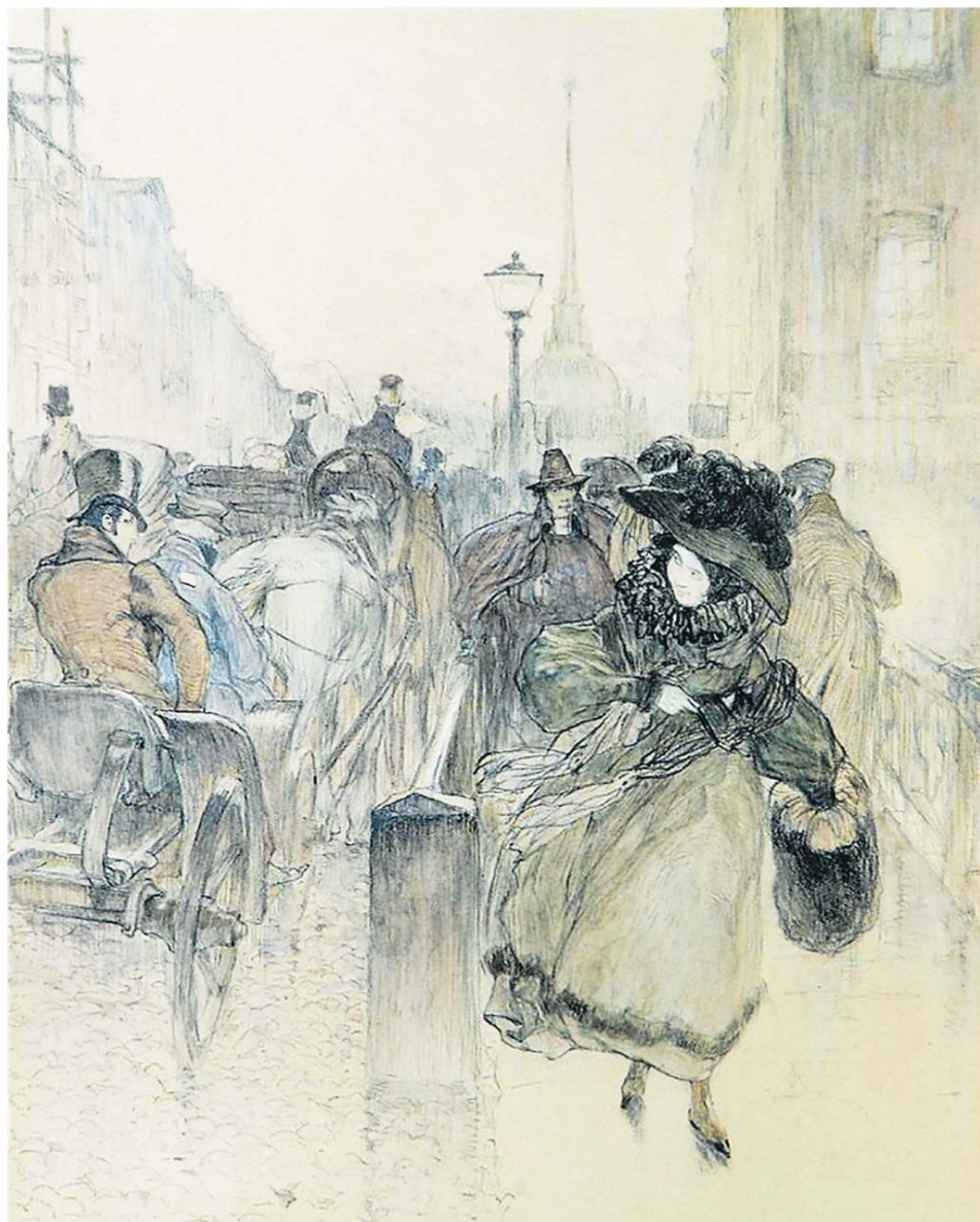
Кардовский Д. Н. Иллюстрация к повести Н. В. Гоголя «Невский проспект». 1904