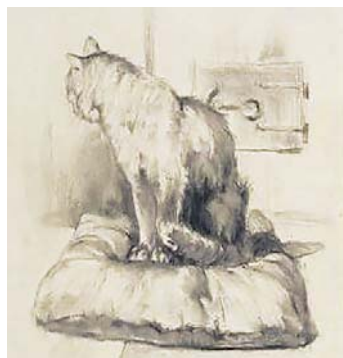
Д. Н. Кардовский. Иллюстрация к рассказу А. П. Чехова «Каштанка». 1903

Еще в студенческие годы, когда Кардовский вместе с товарищем сни-