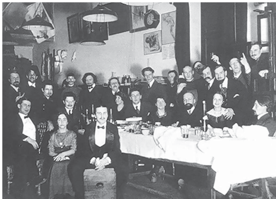
Живописная мастерская профессора Кардовского. 1903–1907