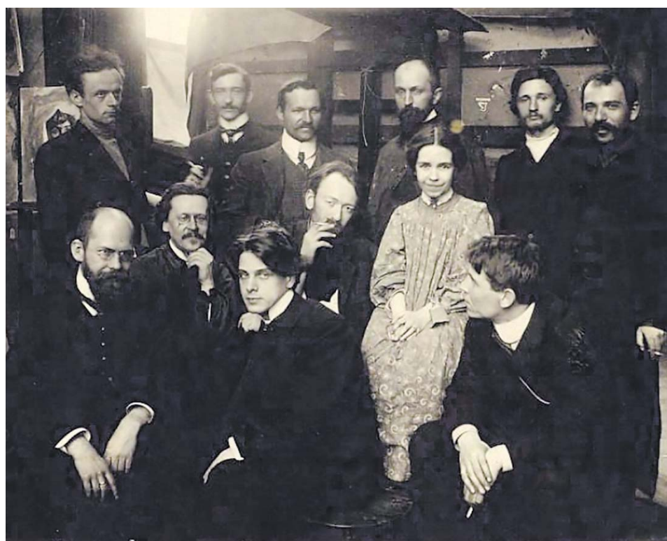
Группа студентов в мастерской Кардовского. 1900-е