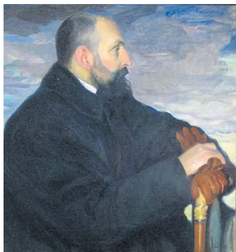
О. Л. Делла-Вос-Кардовская. Портрет мужа, художника Кардовского, 1913