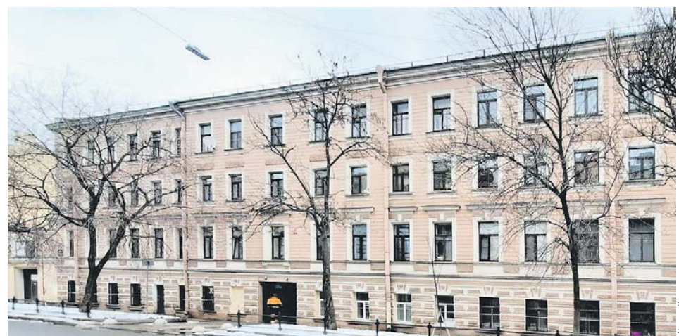
2-я линия В. О., 55

Чтобы быть ближе к мастерской, Кардовский с семьей перебрался в съемную квартиру в доме № 55 на