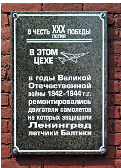
Мемориальная доска Завода имени И. Е. Котлякова

В честь 30-летия Победы в Великой Отечественной войне на одном из корпусов завода была установлена мемориальная доска: «В этом цехе в годы Великой Отечественной войны (1942–1944) ремонтировались двигатели самолетов, на которых защищали Ленинград летчики Балтики».