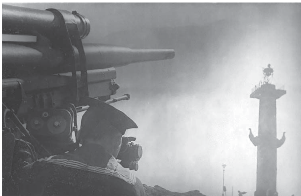
На охране ленинградского неба

Во время блокады Ленинграда Васильевский остров, как и весь город, подвергался обстрелам и бомбежкам. И все же он, по сравнению с южными районами, считался относительным тылом. Работа заводов здесь не прекращалась. Был налажен выпуск различного вооружения, боеприпасов, снаряжения, техники. Ушедших на фронт мужей и братьев заменили женщины, к станкам встали вчерашние школьники, в строй вернулись пенсионеры.