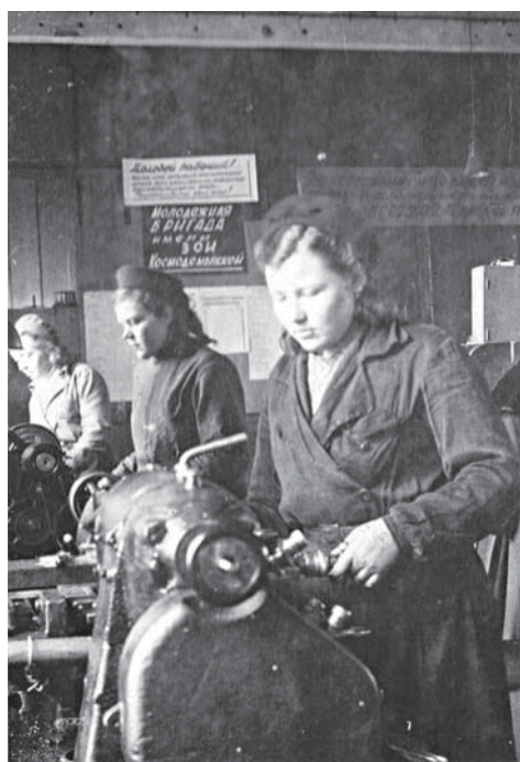
Комсомольско-молодежная бригада токарей имени Зои Космодемьянской Завода имени Н. Г. Козицкого

Недалеко от музея-ледокола «Красин» стоит красное кирпичное здание — там находилось Управление Гидрометеорологической службы Ленинградского фронта. Вся информация по состоянию и прогнозу погоды шла отсюда, что было очень важно для ведения боевых действий.