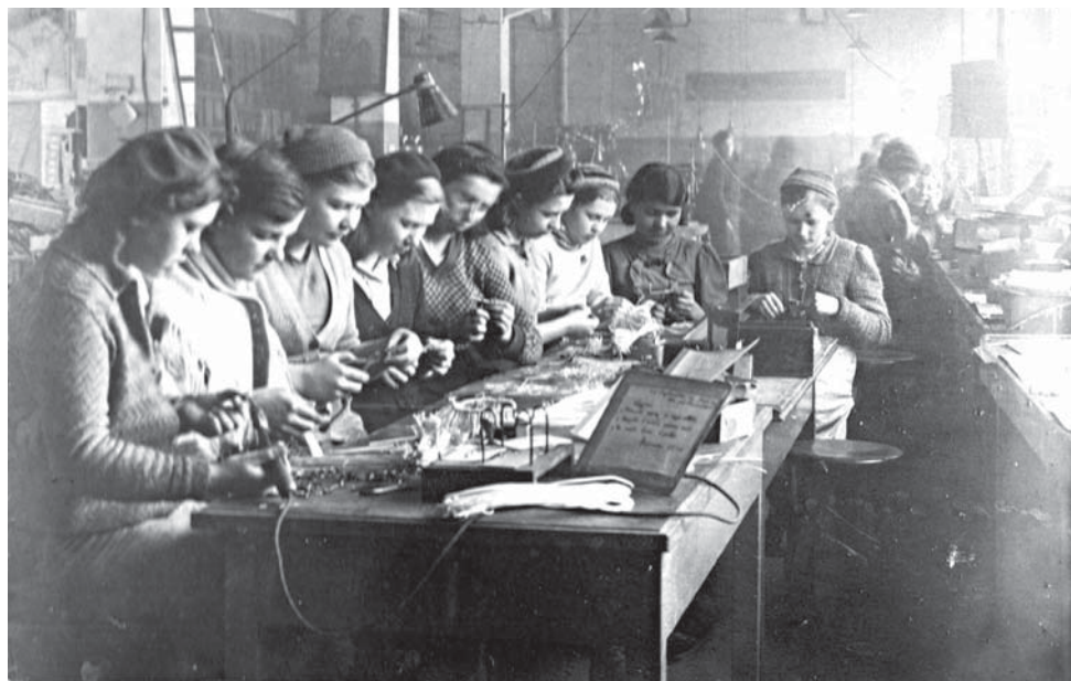
Комсомольско-молодежная бригада имени Олега Кошевого Завода имени Н. Г. Козицкого за работой. 1944 г.

В апреле 1944 года авиационная ремонтная база закончила свою работу. Перед страной вставала задача восстановления народного хозяйства. Заводу было дано первое задание по выпуску мирной продукции.