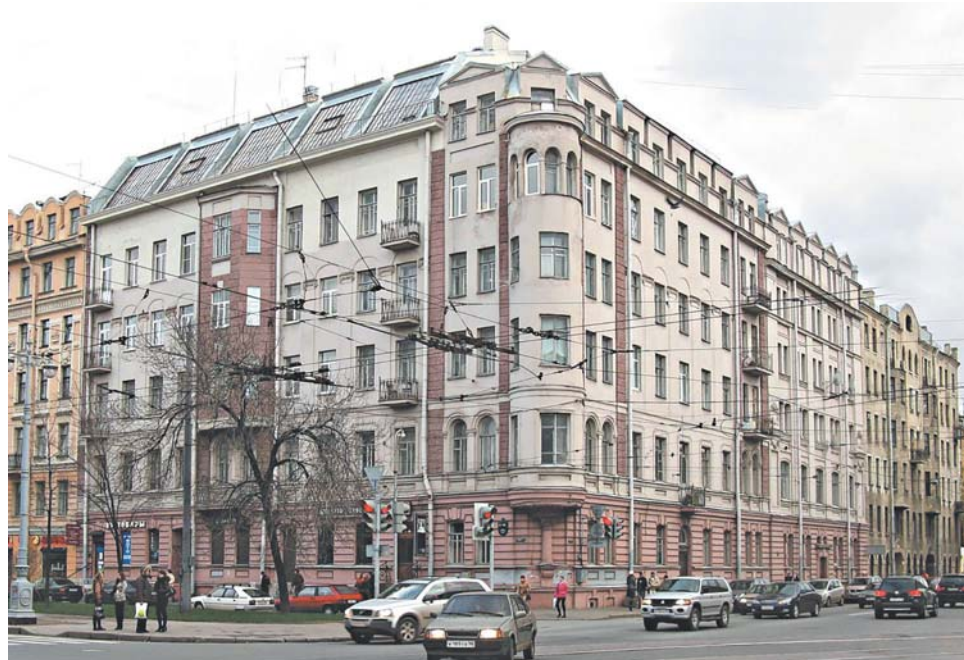
Большой проспект, д. 64