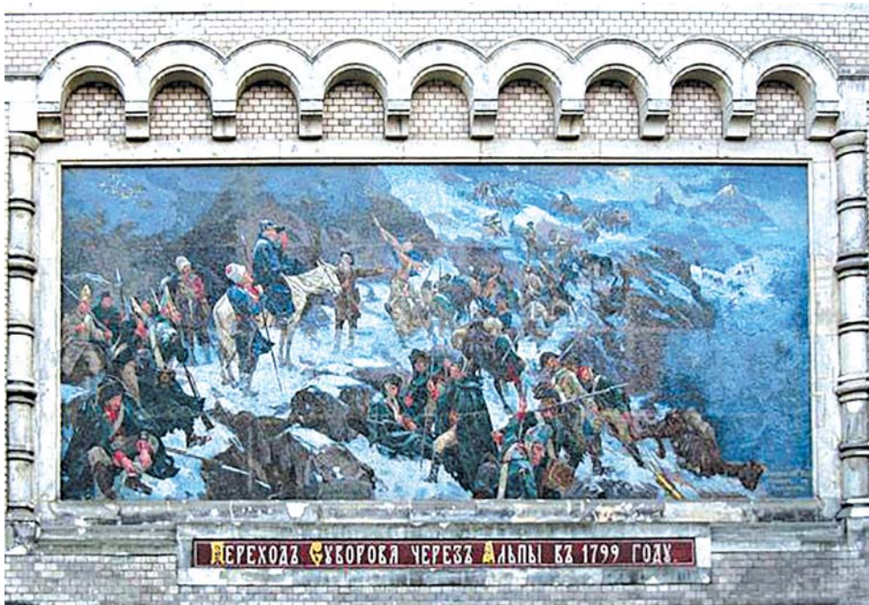
Мозаичное панно. Музей А. В. Суворова