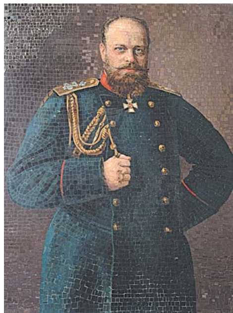
Портрет Александра III