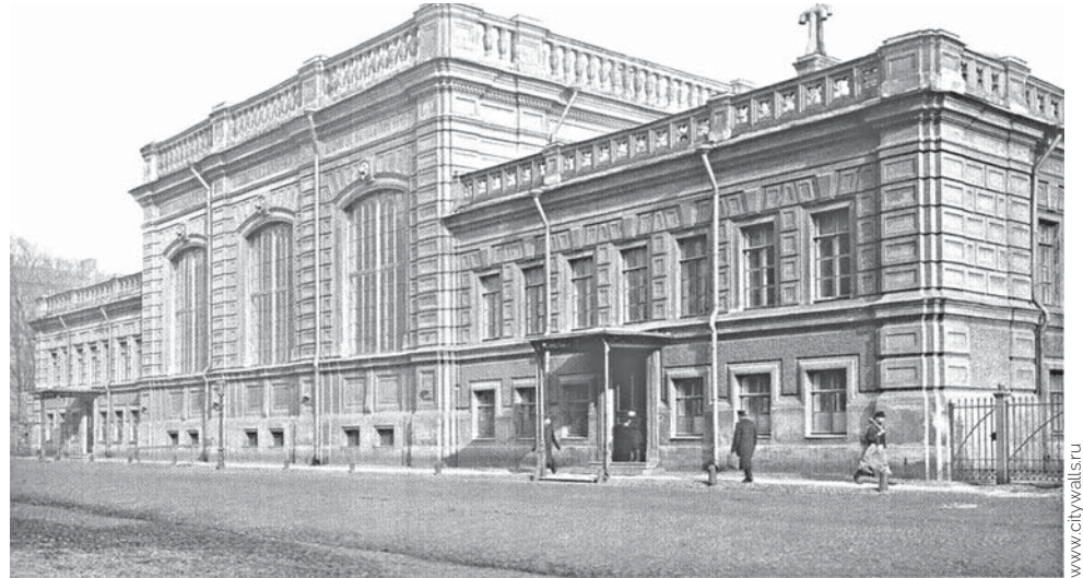
Мозаичные мастерские Академии художеств. 3-я линия, 2а. Фото 1914 г.

Ситуацию спасает выдающийся архитектор, автор проекта Мавзолея Алексей Щусев. Его обязательным условием было оформление Траурного зала