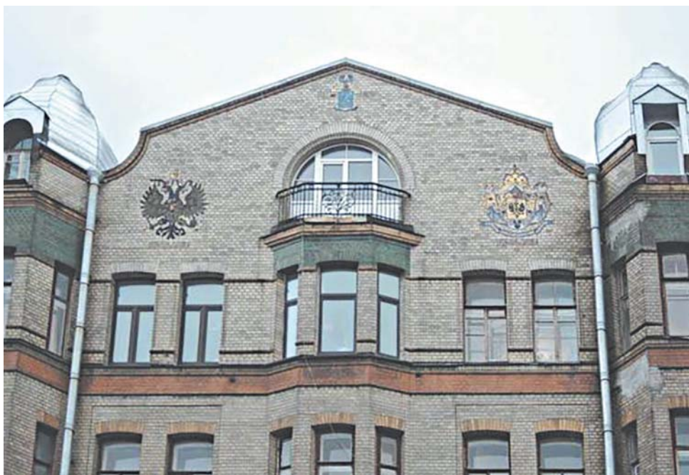
Аптека Пеля. 7-я линия, 16–18