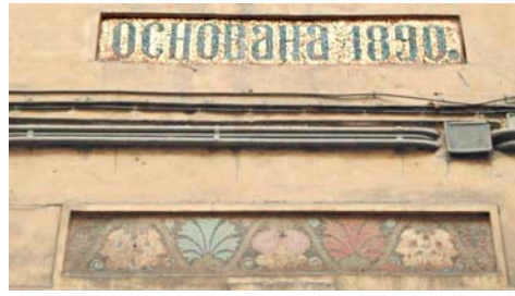
Вывеска на мастерской