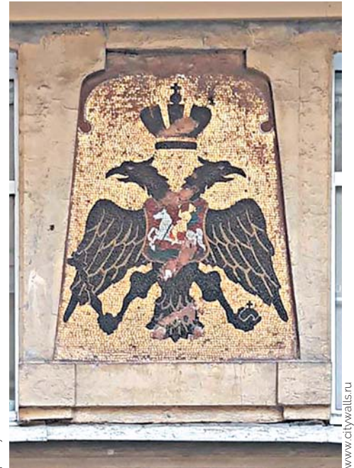
Отмытая мозаика на мастерской Фроловых