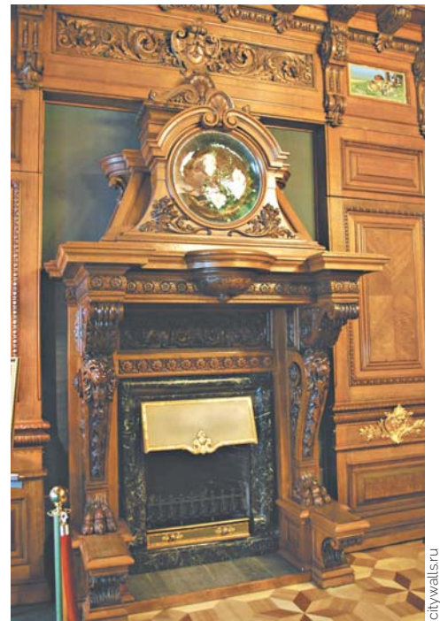
Камин в Дубовом зале. Биржевая линия, 14