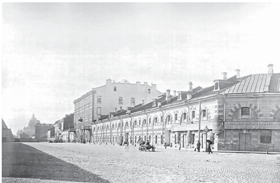
Перспективный вид Биржевой линии. Винные склады торгового дома «Братья Елисеевы». 1870–1880-е гг.