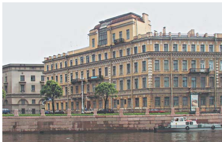
Доходный дом Елисеевых на Биржевой линии, 18. Вид со стороны Невы