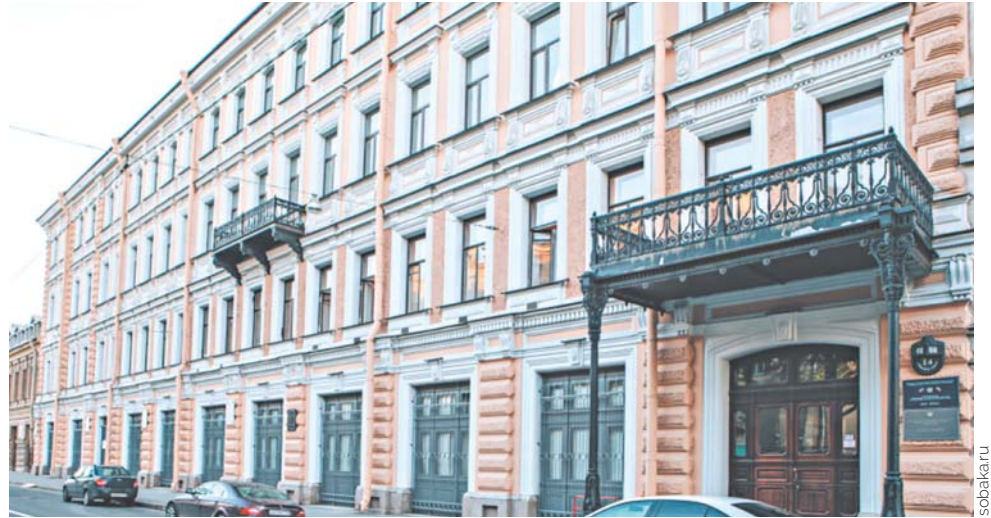
Дом Елисеевых. Биржевая линия, 14