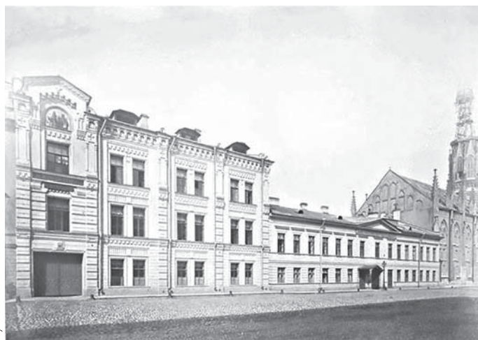
Елизаветинская богадельня. 1870-е гг.

Татьяна Сидельникова, сектор краеведения Библиотеки им. Л. Н. Толстого