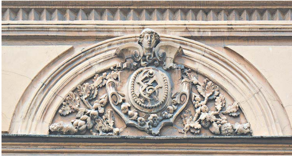
Монограмма на фасаде дома 12 по Биржевой линии