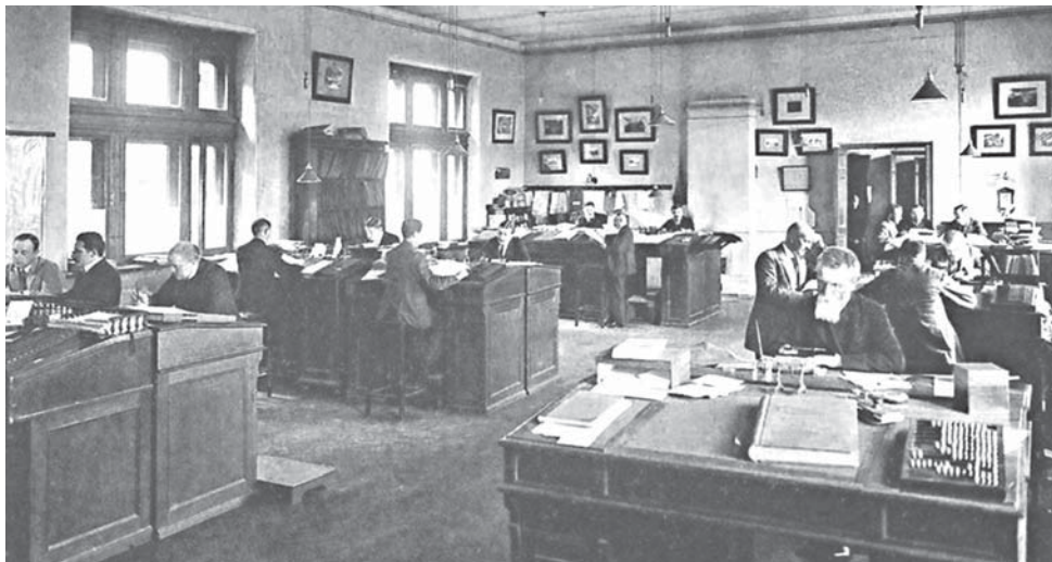
Контора Елисеевых. 1913 г.

Так на карте Васильевского острова появилась Елизаветинская богадельня «для призрения престарелых и увечных в Санкт-Петербурге граждан». Летом 1855 года Елисеев купил одноэтажный дом с садом на 3-й линии Васильевского острова. Архитектор Карл Андерсон перестроил его для нужд богадельни. Первоначально там нашли приют 15 мужчин и 25 женщин. А в домовых церкви богадельни с той поры крестили, венчали и отпевали большинство членов семьи Елисеевых. Накануне 50-летия учреждения здание расширили: теперь там могли разместиться 100 женщин, 25 мужчин и 40 квартирантов.