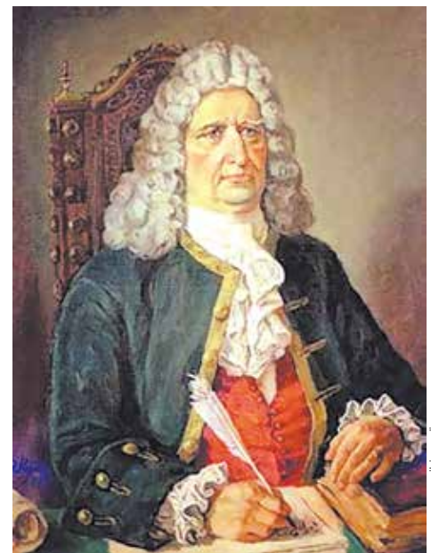
Герхард Фридрих Миллер, русско-немецкий историограф, естествоиспытатель и путешественник. Действительный член Императорской Академии наук и художеств в Санкт-Петербурге