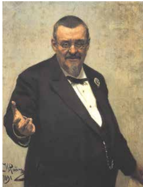
И. Е. Репин. Портрет Владимира Спасовича. 1891 г.

«20-ти», «17-ти», «14-ти», польской партии «Пролетариат», «21-го», «22-х» и других. Громкий резонанс вызвала его защита по делу Кроненберга, которое послужило Ф. М. Достоевскому материалом для главы «Прелюбодей мысли» в романе «Братья Карамазовы» (именно