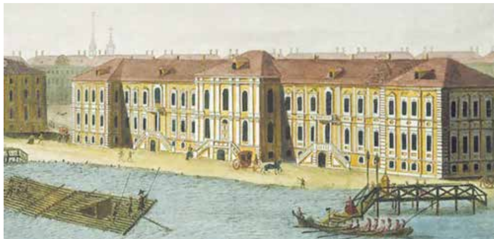
Дворец Прасковьи Федоровны

Соседние особняки Строганова и Демидова были представительными: трехэтажными, на подвалах, большой протяженности по фасаду, с высоким двухмаршевым крыльцом. По своему облику они были характерны для Петербурга первой трети