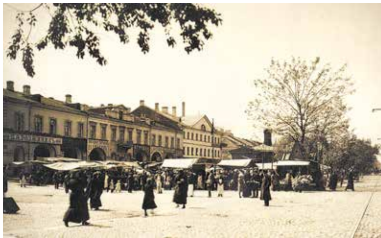
Большой проспект Васильевского острова с рельсами для конки. Фото начала XX века

Мастер медальерного дела, скульптор, живописец и рисовальщик Федор Толстой весь талант отдавал ученикам, готовя их к служению высокому искусству. В 1828 году он перебрался из казенной преподавательской квартиры на 3-й линии в академи-