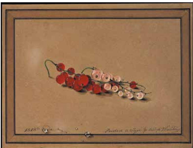
Ф. П. Толстой. «Ягоды красной и белой смородины». 1818 год