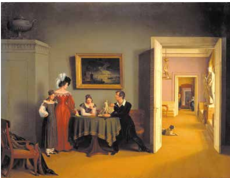
Ф. П. Толстой. «Семейный портрет». 1830 год