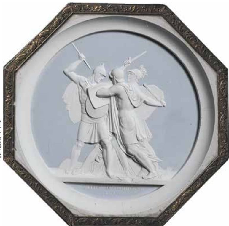
Ф. П. Толстой. Один из медальонов, посвященный событиям Отечественной войны 1812 года. Барельеф. 1816 год

Когда Федора Петровича избрали в 1809 году в почетные члены Академии художеств, молодые обвенчались в храме Благовещения. На нем был неизменный морской мундирчик, на ней — простое белое платье и венок из живых цветов, выращенных в своем саду. Молодые вернулись в дом новоиспеченной супруги, пообедали и отправились в сад: поливали цветы, катались в лодке по пруду и под вечер играли в горелки на большом круглом лугу. По-