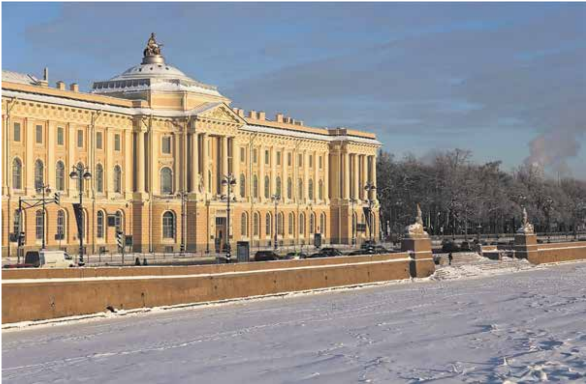
Академия художеств. Современное фото