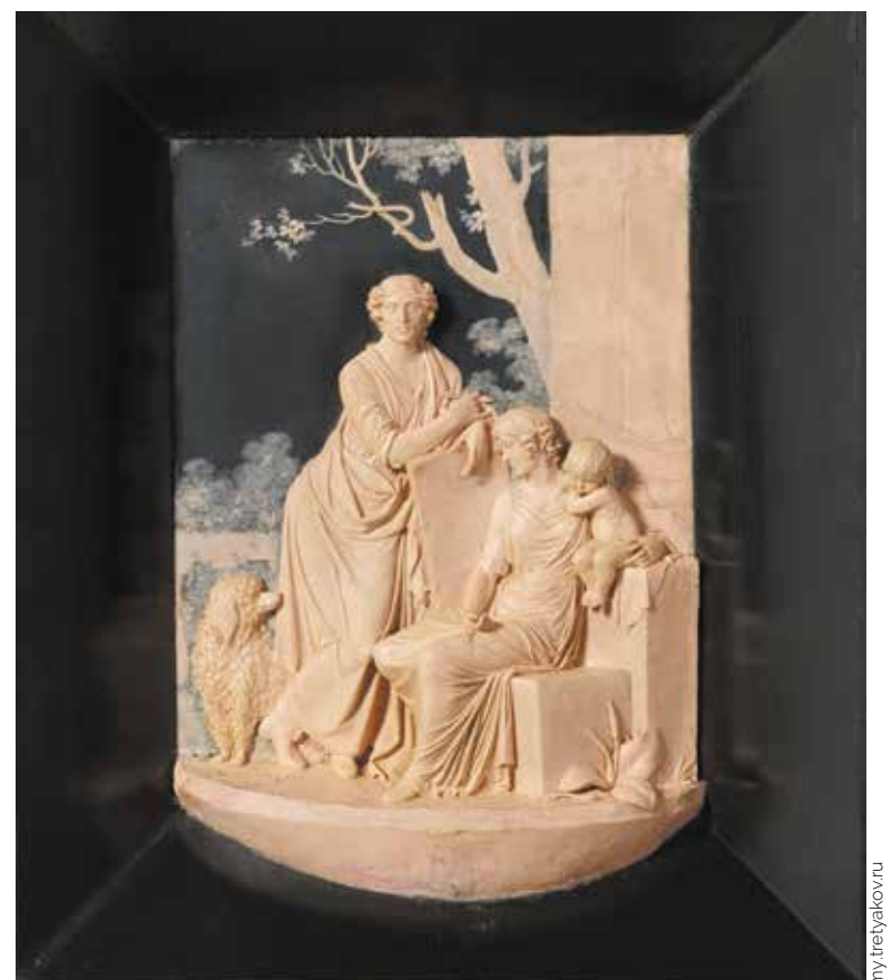
Ф. П. Толстой. Автопортрет с семьей. Горельеф. 1812 год