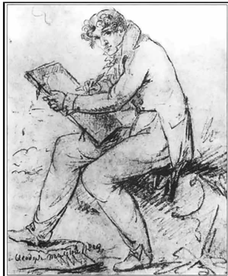
Художник Федор Толстой. Автопортрет. 1810 год