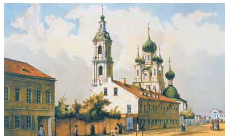
Церковь Благовещения Пресвятой Богородицы. Литография Ф.-В. Перро. 1840-е гг.

завершилась история некогда известной и успешной купеческой фамилии в Петербурге.