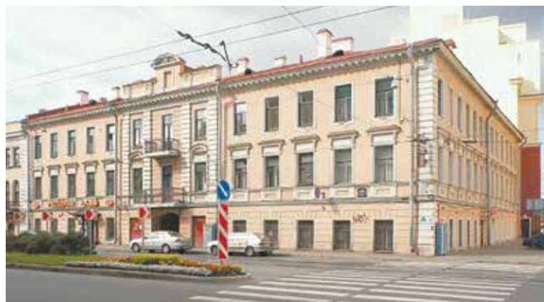
Дом Демидовых — Малый пр. В. О., 3