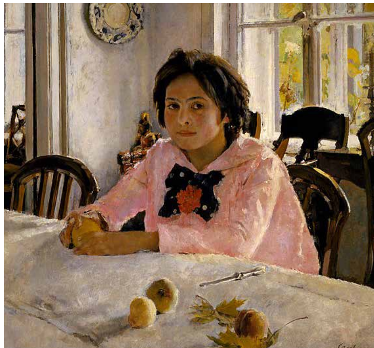
В. Серов. «Девочка с персиками», 1887 г.