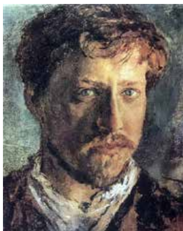
Валентин Серов. Автопортрет. 1880-е годы