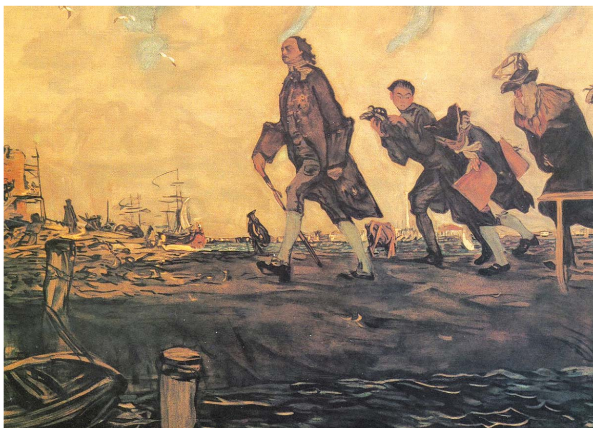
В. Серов «Петр I». 1907 год

Усадьба светлейшего князя протянулась через весь Васильевский остров от Большой до Малой Невы. На ее территории располагались бани, медоварня, хлебопекарня, кузница. За дворцом был разбит сад, где за короткое петербургское лето поспевали дыни. От сада на запад через лес отходила прямая как стрела просека. Она пронизывала весь Васильевский остров до самого взморья. В конце просеки, на берегу залива, виднелся высокий