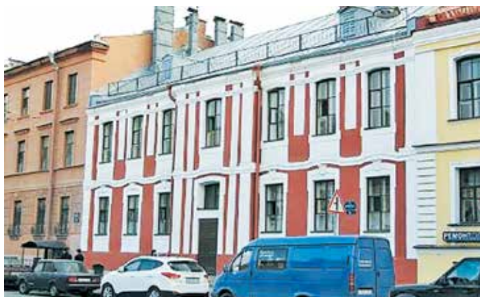
Подворье Александроневской лавры, автор проекта Ж.-Б. Леблон