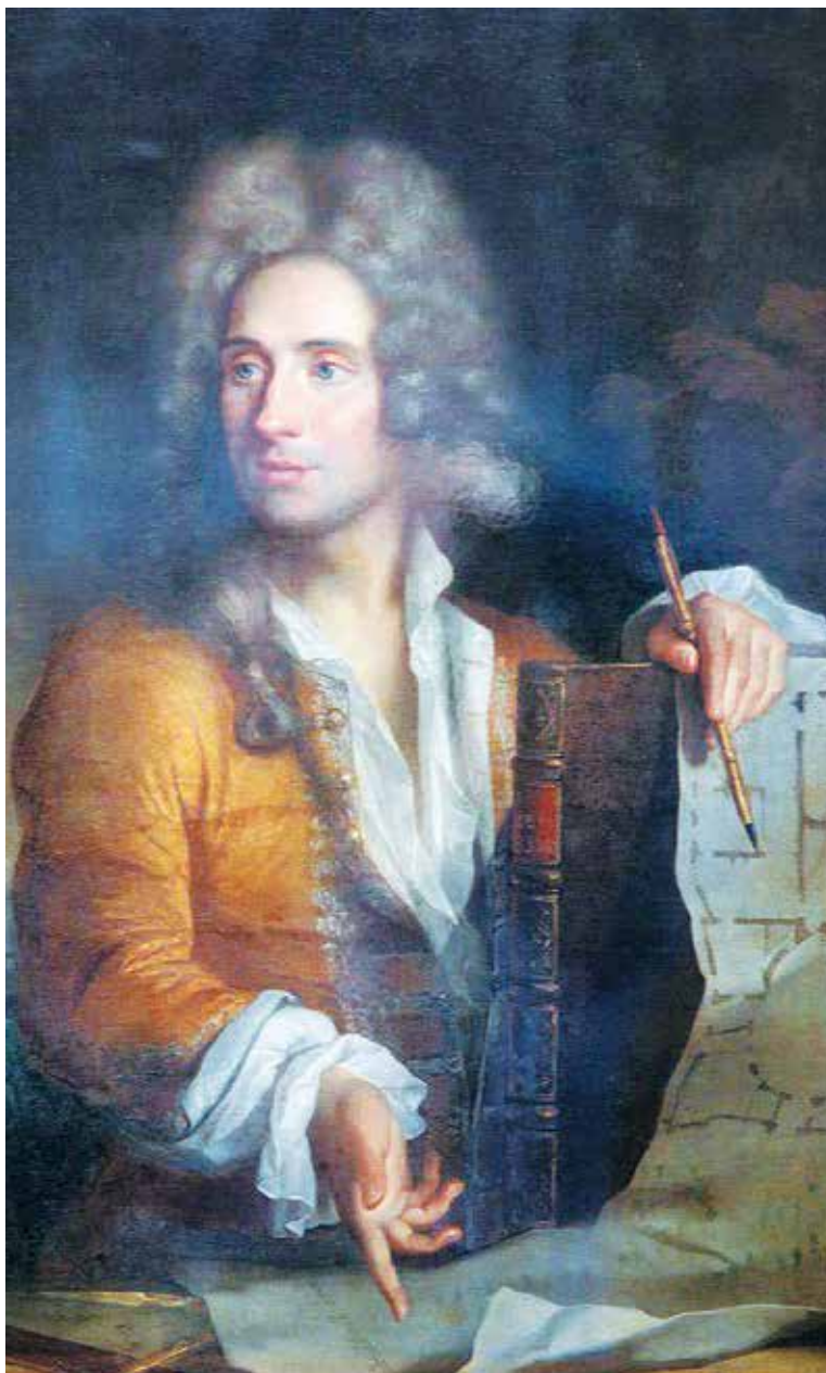
Портрет Ж.-Б. Леблона до прибытия в Россию. 1710-1714 годы

Леблон приехал в Петербург не один. Вместе с ним в столицу приехали его жена Мария Левюкс, сын и племянница, два лакея и служанка, а также большая группа французских мастеров разных специальностей. Для их размещения был выделен обширный участок с домами недалеко от усадьбы Меншикова, на месте пересечения современного Большого проспекта с 1-5-й линиями Васильевского.