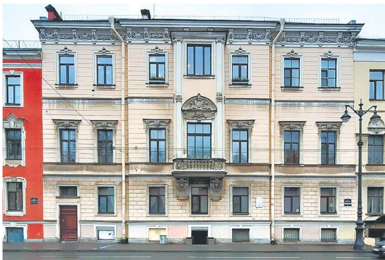
1-я линия В. О., д. 4