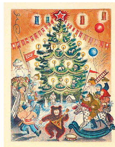
Открытка «Новогодняя елка»