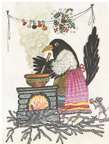
Иллюстрация к сказке «Сорока-белобока»