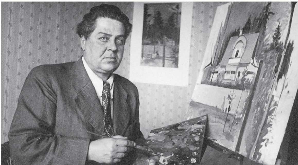
Юрий Алексеевич Васнецов, 1950-е годы

Квартира Васнецовых находилась на 1-й линии в доме № 4 с выходом в Соловьевский переулочек, ныне улица Репина. Это было место обитания художников, своего рода петербургский Монмартр.