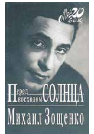
Автобиографическая книга Михаила Зощенко «Перед восходом солнца»