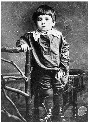
Миша Зощенко в детстве