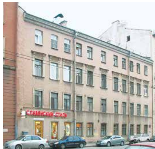
9-я линия В. О., дом 70