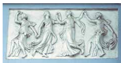
Танцующие менады. Элемент фасада