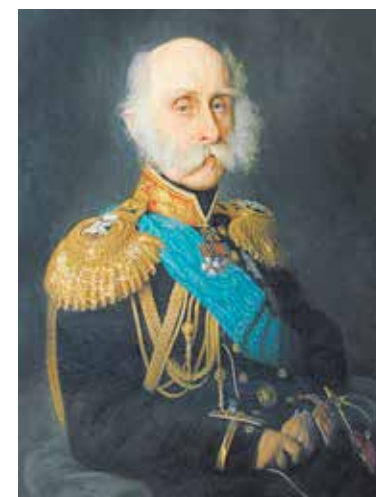
Федор Петрович Литке