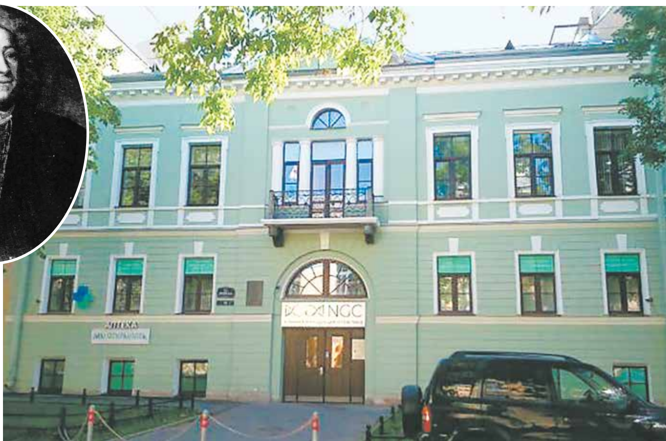
Дом Семеновой на 13-й линии В. О.