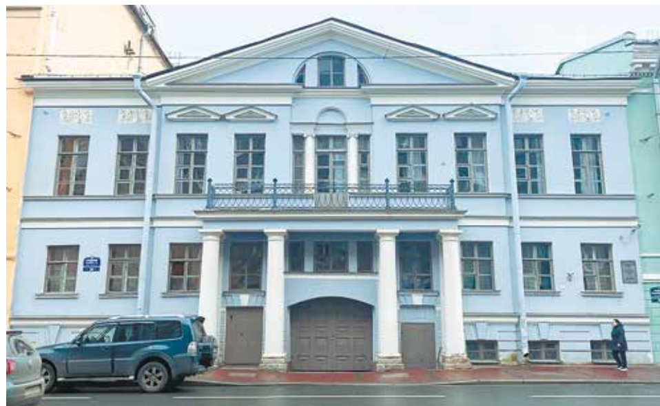
Дом Аладова на Среднем проспекте

В 1820-х годах, когда участком владел купец Эрнст Марш, дом был перестроен с оформлением фасада в классическом стиле. Здание приобрело благородные пропорции и сдержанную нарядность. Над воротами появилось широкое полуциркульное окно, второй этаж украсило трехчастное окно с пилястрами и балконом. Завершил фасад карниз с модульонами (не сохранились). В интерьерах второго этажа сохранились элементы клас-