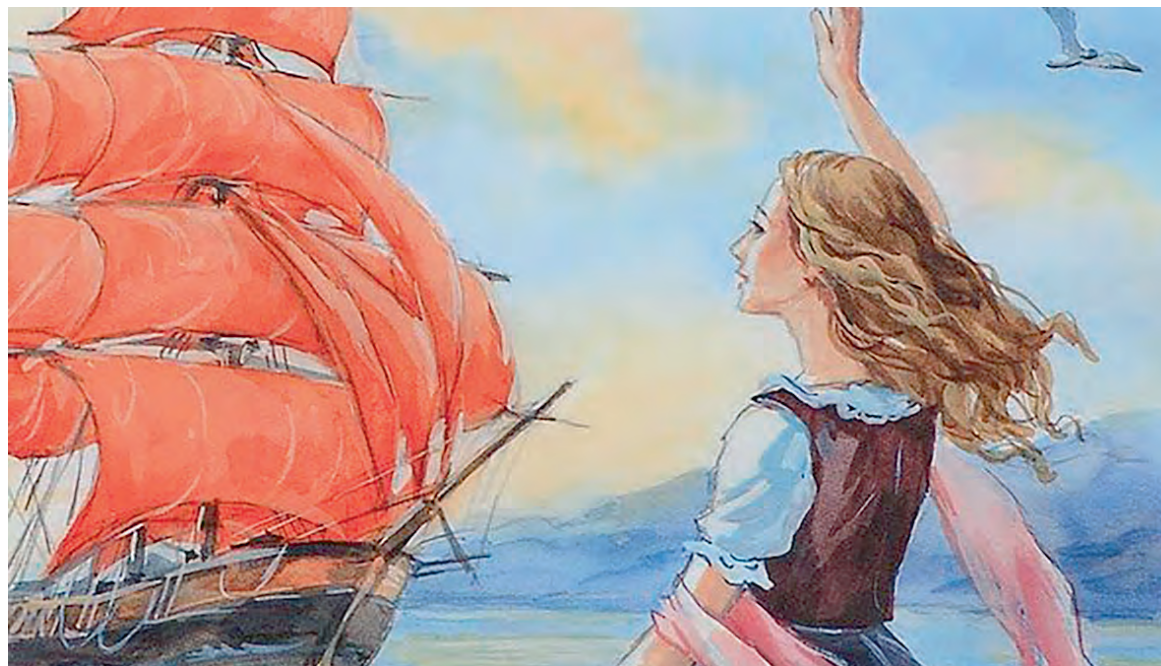
Иллюстрация к повести Александра Грина «Алые паруса»

«Жизнь с Александром Степановичем показалась мне сначала идиллией, но она быстро кончилась, — вспоминала потом Вера. — За год своего пребыва-