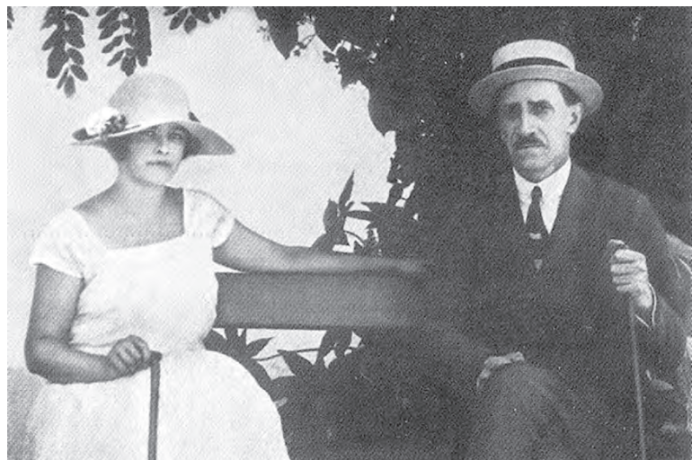
Александр Грин и его вторая жена Нина