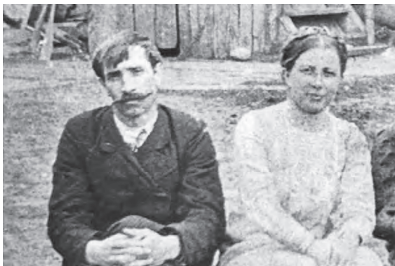
Александр Грин и Вера Абрамова

По решению Топонимической комиссии Петербурга бульвар в Гавани назван в честь Грина. Он тянется от площади Европы к Финскому заливу. Появление бульвара Грина на Васильевском острове само по себе символично, обозначая и отправную точку пути писателя в литературу, начало его петербургского периода, и гавань для его галиота «Секрет».