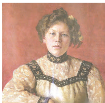
А. П. Остроумова-Лебедева. Автопортрет. 1900-е гг.