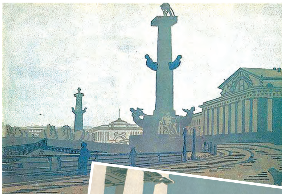
Петербург. Ростральные колонны и Биржа. 1908 г.

Ее мечтой было попасть в мастерскую Ильи Ефимовича Репина, и это удалось, хотя их отношения складывались временами по-разному. Анна Петровна писала: «Милый Репин! Я то люблю его, то нена-