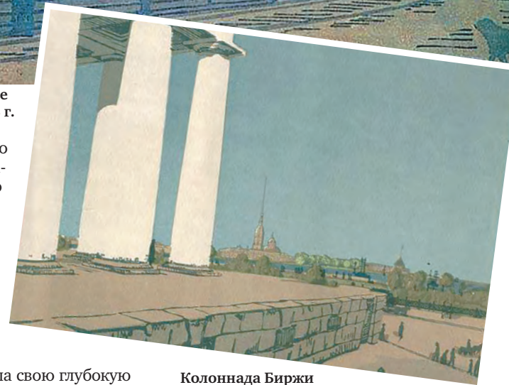
Колоннада Биржи и Петропавловская крепость. 1907 г.