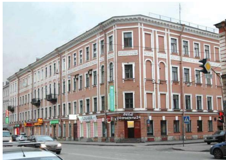
Кадетская линия, дом 7