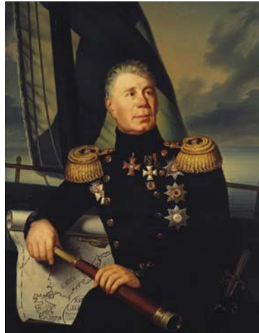
Иван Федорович Крузенштерн

Буквально только что в Петербурге и на Васильевском острове прошли торжества, приуроченные ко Дню Военно-морского флота. На Васильевском жил человек, имеющий самое непосредственное отношение к развитию морского дела и славе русского флота, — адмирал Иван Федорович Крузенштерн.