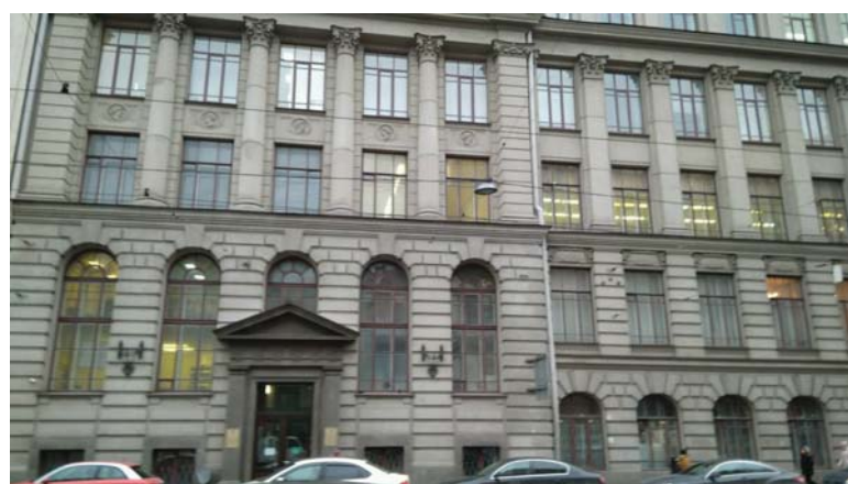
Средний проспект В. О., дом 41