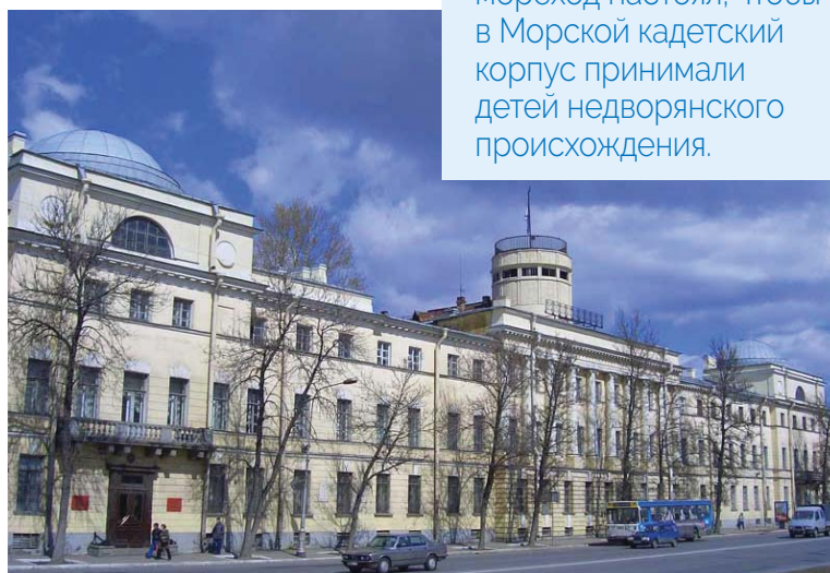
Здание Морского кадетского корпуса на набережной Лейтенанта Шмидта

Прославленный мореход настоял, чтобы в Морской кадетский корпус принимали детей недворянского происхождения.