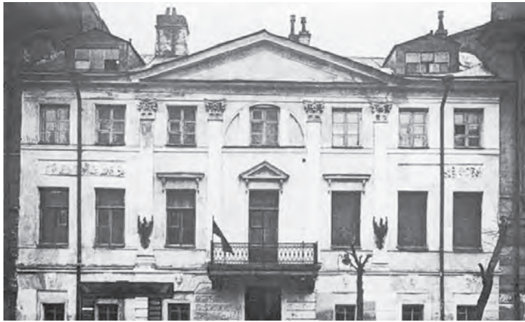
Дом Брюллова. Кадетская линия В. О., 21. Фото 1927 года

Трудовые будни в доме на Среднем проспекте сменялись веселыми праздниками. Когда старшие сыновья приходили из академии домой в воскресные и праздничные дни, в семье устраивались литературные вечера с танцами, ставились «живые картины», разгадывались шарлады.