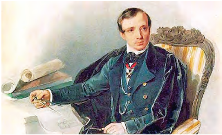
Александр Павлович Брюллов

31 декабря 1820 года Александр Брюллов окончил курс обучения в Академии художеств. Но вскоре Общество поощрения художников посылает его вместе с Карлом в пенсионерскую поездку за границу для усовершенствования навыков в искусстве.