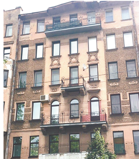
6-я линия, дом № 41. Деревянный дом не сохранился