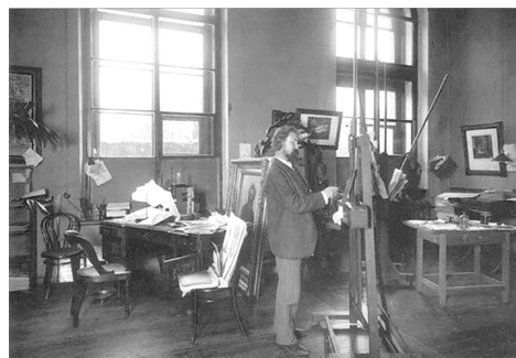
И. Е. Репин в своей мастерской в Академии художеств. 1913 г.