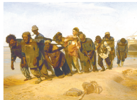
Над картиной «Бурлаки на Волге» Илья Репин работал на острове