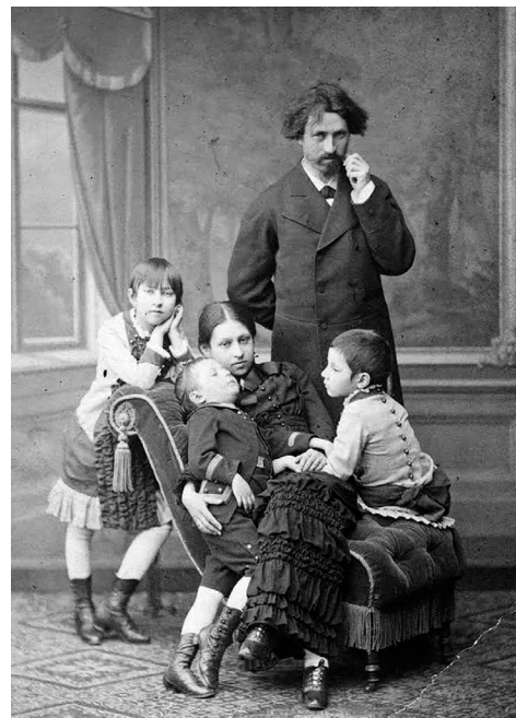
Репин в кругу семьи. 1883 г.