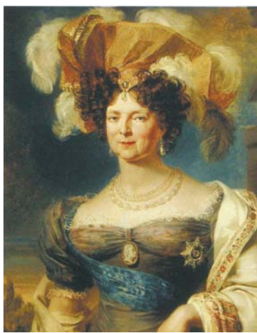
Вдовствующая императрица Мария Федоровна