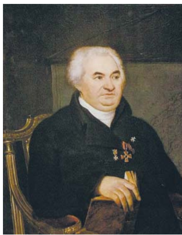
О. А. Кипренский. Портрет И. В. Кусова. 1808 г.

В 1828 году сыновья Кусова за 375 тысяч рублей продали дом