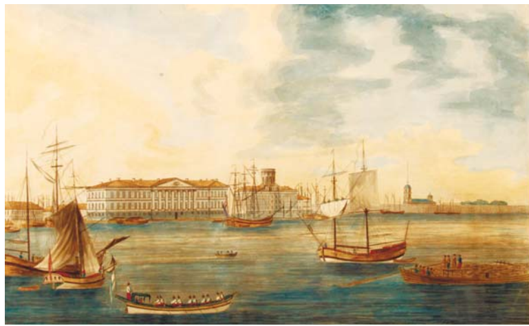
Вид с Невы на набережную Васильевского острова

силисой, либо от основавшего здесь погост купца Василия, либо от жившего якобы на Стрелке отшельника-раскольника старца Василия.