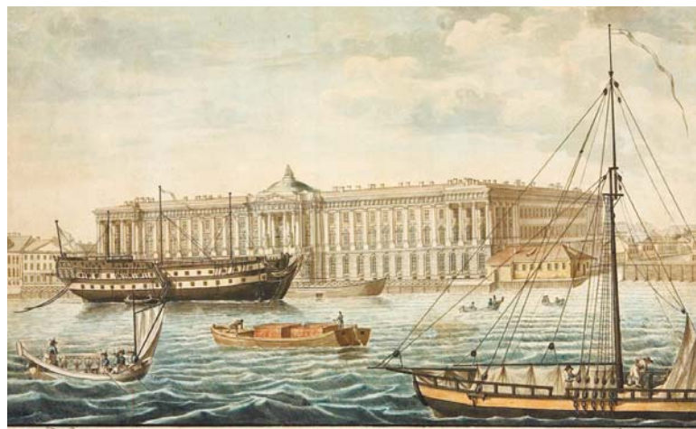
Вид Академии художеств. Гравюра