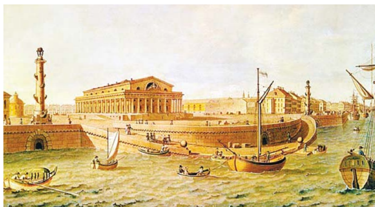
Б. Патерсон. Вид на Стрелку Васильевского острова

шие острова. Сегодня от множества маленьких островков в невской дельте, примыкавших некогда к Васильевскому, в результате градостроительной деятельности остались остров Декабристов (Голодай) и островок Серный со стороны Малой Невы. В связи с тем что район — это единая административно-территориальная единица, в состав которой наряду с основным — Васильевским — входят и другие острова, днем его основания можно считать 27 октября 1737 года.