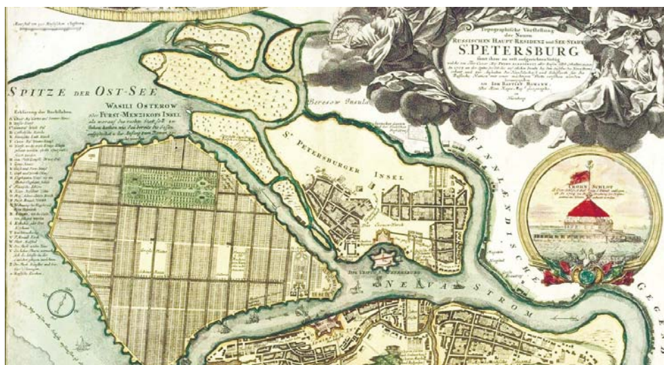
План Доменико Трезини. 1716 год

Васильевский остров, который изначально именовался Преображенским, — это историческая часть Санкт-Петербурга, самый крупный остров в дельте Невы, рассекающий ее на два больших рукава — Большую Неву на юге и Малую Неву на севере. На западе Васильевский остров омывается водами Финского залива, а на севере отделяется рекой Смоленкой от острова Декабристов (бывшего острова Голодай).