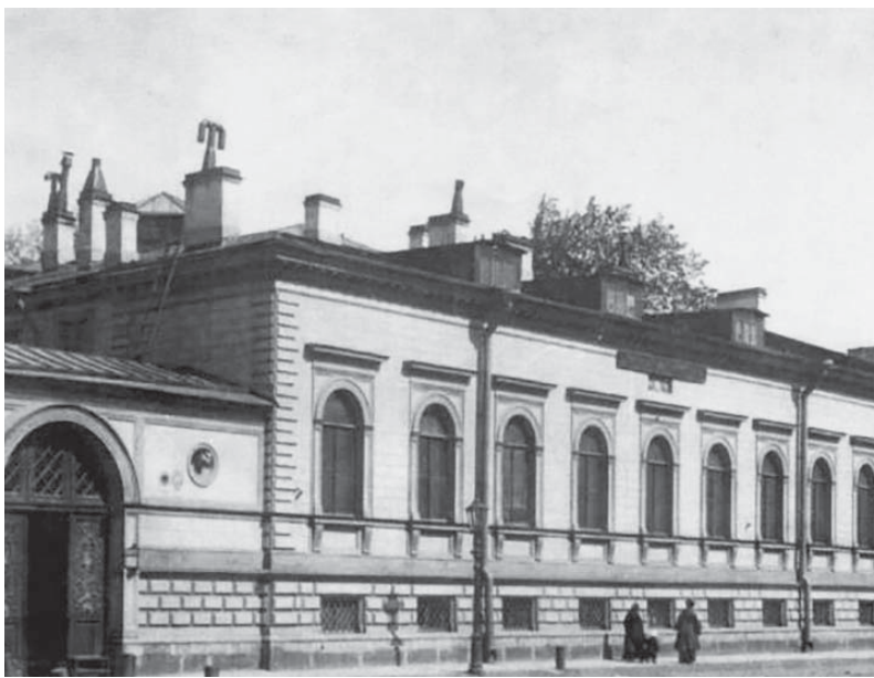
Обособняк Боссе. 4-я линия В. О., дом 15