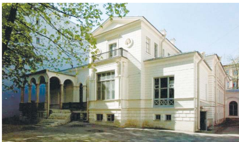
Дворовый фасад особняка Боссе

Годы наиболее активной творческой деятельности выдающегося архитектора неразрывно связаны с Петербургом. Построенные им дома и особняки украшают улицы нашего города, в том числе и Васильевского острова.