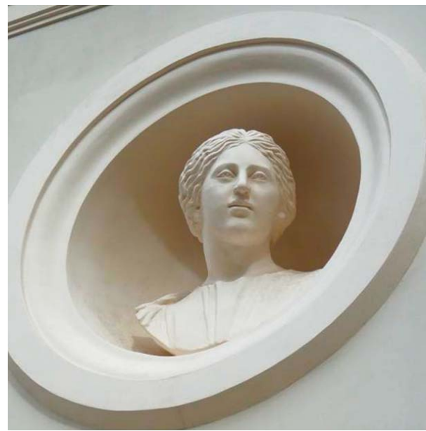
Обособняк Боссе. Фрагмент

Годы наиболее активной творческой деятельности выдающегося архитектора неразрывно связаны с Петербургом. Построенные им дома и особняки украшают улицы нашего города, в том числе и Васильевского острова.