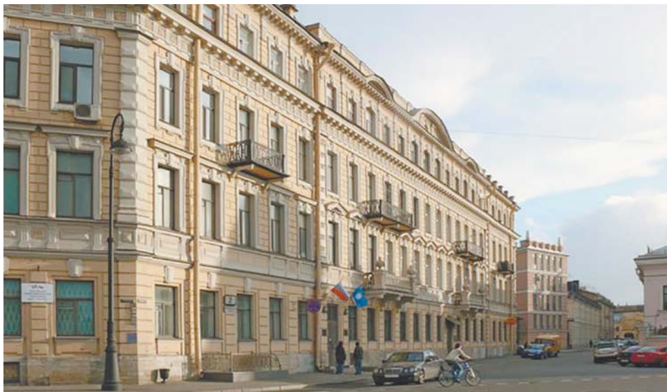
Наб. Макарова, д. 10