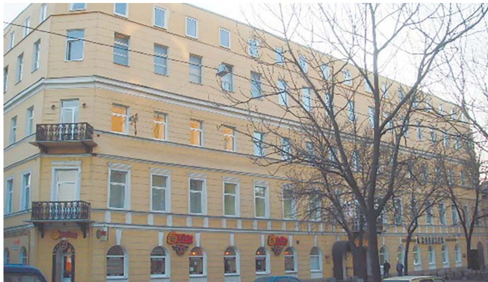
17-я линия В.О., д. 4