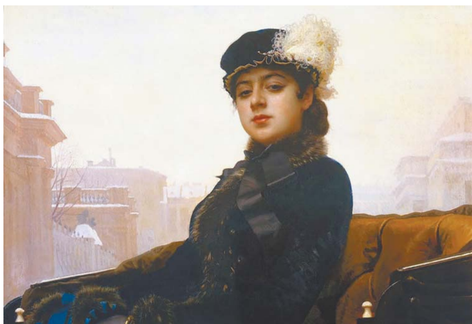
И. Н. Крамской. «Неизвестная». 1883 г.

Жизнь прославленного живописца Ивана Крамского неразрывно связана с Васильевским островом. Именно здесь он создал свои наиболее знаменитые картины. 1856 год. Из Воронежской губернии в Петербург прибыл молодой человек девятнадцати лет. Поступил на службу ретушером в ателье известного столичного фотографа И. Ф. Александровского. Звали его Иван Крамской.