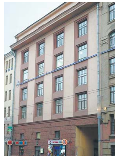
9-я линия, дом 36

После 1836 года Гоголь бывает в столице лишь наездами.