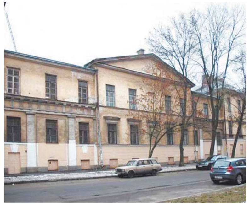
10-я линия, дом 3

ском коридоре среди бюстов и портретов выдающихся профессоров университета находится и портрет Н. В. Гоголя. Здесь же в одной из старых аудиторий главного здания есть мемориальная доска в память о писателе. Но Николай Васильевич читал лекции не в этом здании, а в старом доме на Кабинетной улице, куда университет был временно переведен. Ныне — это улица Правды. Дом не сохранился. Успехи на попечи преподавания оказались кратковременными.