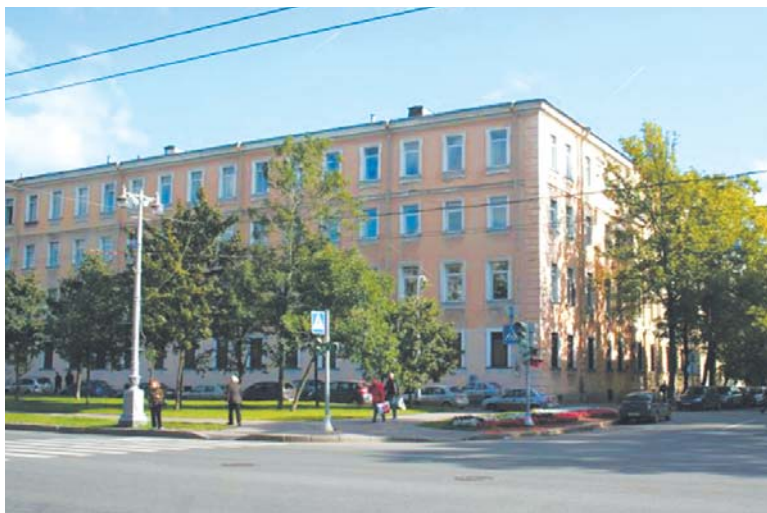
12-я линия, дом 3

за обучение будет удерживаться жалование Гоголя, и писатель обязуется неотлучно состоять при учебном заведении.