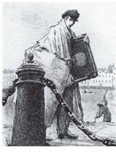
Художник Чартков из повести «Портрет»