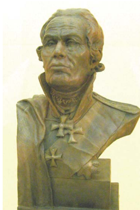
Бюст адмирала Ушакова, реконструкция облика