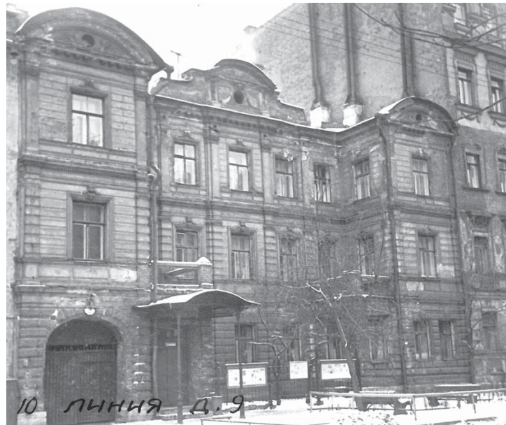
Дом, фото 1950-х годов