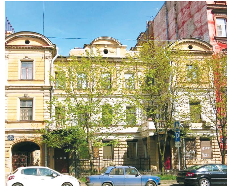
Современный вид дома

В 1804 году на Васильевском острове Федор Федорович составил подробнейшую записку о своем служении Российскому флоту: «Благодарение Богу, при всех означенных боях с неприятелем и во всю бытность онаго флота под моим начальством на море, сохранением Всевысочайшей Благодости ни одно судно из онаго не потеряно и пленными ни один человек из наших служителей неприятелю не достался».