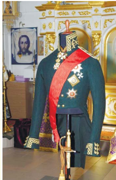
Мундир и ордена Федора Ушакова

находим следующее: «Продается деревянный дом Адмирала Ушакова, хорошо устроенный около всего двора, с небольшим двухэтажным каменным флигелем и с двумя особо отделенными вновь построенными домиками. Все строение на каменном фундаменте, прочные, и при нем красивый садик, хорошо расположенный, наполненный разными деревьями и с двумя беседками в оном, состоящий на Васильевском острове, в 10-й линии, близ Большого проспекта, под № 238; о цене спросить в оном же доме. Тут же продается Аглинская двухместная прочной и крепкой работы карета» — газета «Санкт-Петербургские ведомости» № 49 за 1810 год».