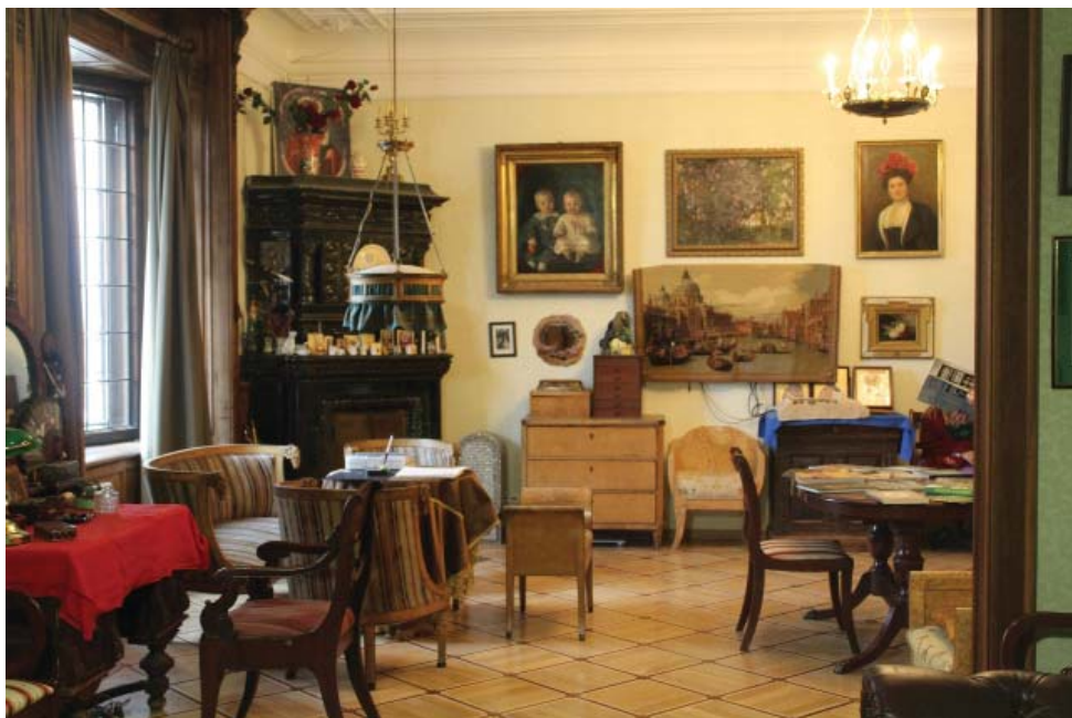
Музей-квартира Л. Н. Бенуа