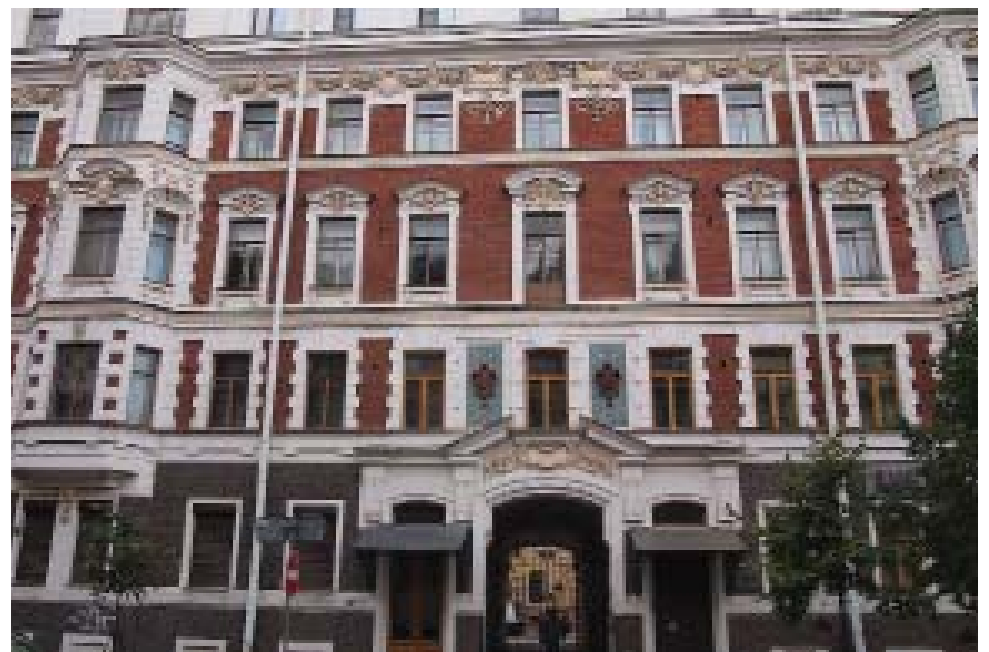
Дом Бенуа. 3-я линия, 20