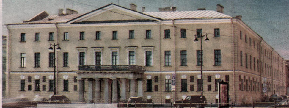
Дом академиков. Современное фото

международных конгрессах. Научные труды профессора регулярно издавались. Во все возглавляемые им научные учреждения поступало новое оборудование, при его институтах появились клиники психических и нервных заболеваний.