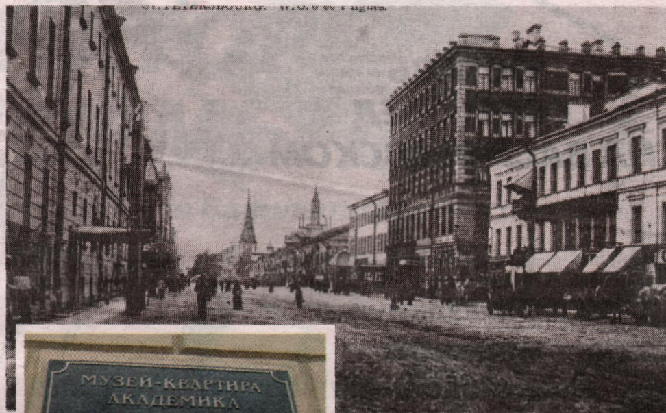
Вид на 6-ю и 7-ю линии. Слева — Дом академиков

В последние годы, несмотря на почтенный возраст, Иван Петрович по-прежнему активно работал в Институте экспериментальной медицины и в Физиологическом институте Академии наук, выступал на