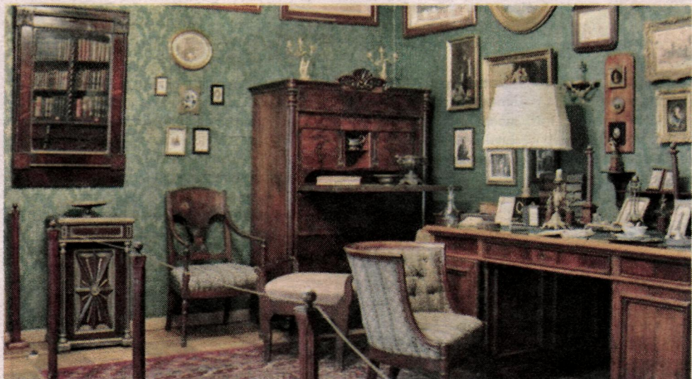
Интерьер квартиры И. П. Павлова