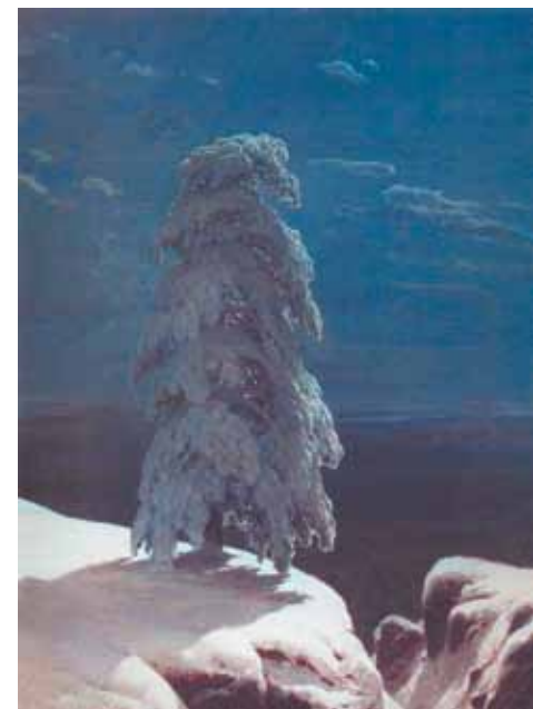
На севере диком. 1891 г.

упала на колени. Мастер больше не проронил ни слова и тихо ушел в вечность, оставив после себя бессмертное наследие. Художника сначала похоронили на Смоленском православном кладбище, а в середине XX века его прах перевезли в Александро-Невскую лавру.