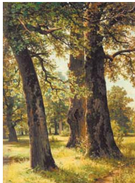
Дубы. 1887 г.