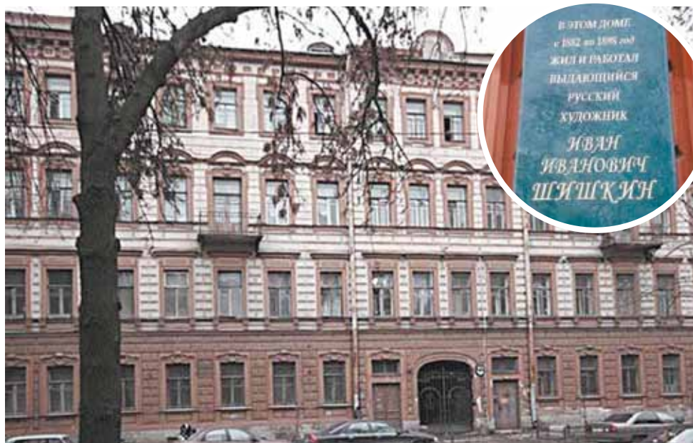
5-я линия В. О., д. 30. Наши дни

Материал подготовлен Маргаритой Елизаревой, сектор краеведения библиотеки им. Л. Н. Толстого