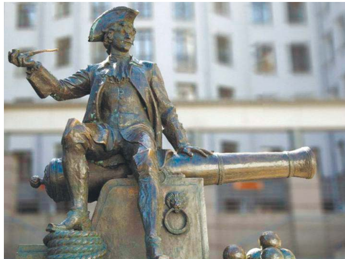
Памятник Василию Корчмину на 7-й линии В. О.