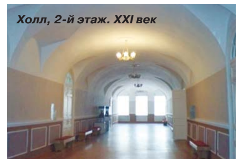
Холл, 2-й этаж. XXI век