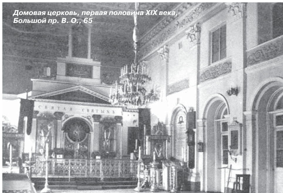
Домовая церковь, первая половина XIX века, Большой пр. В. О., 65