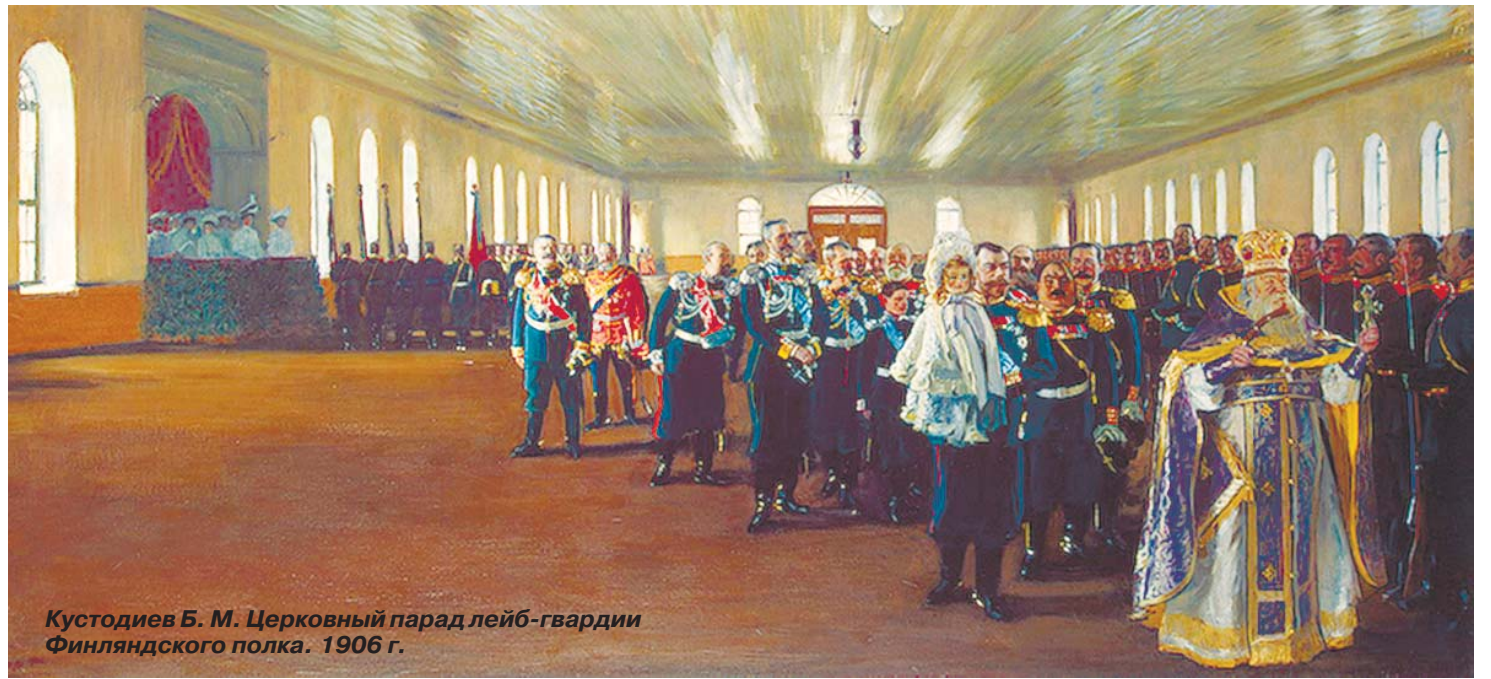
Кустодиев Б. М. Церковный парад лейб-гвардии Финляндского полка. 1906 г.

После 1917 года в здании госпиталя Финляндского полка размещались окружной лазарет Военно-санитарного управления, полевой запасной госпиталь № 725, госпиталь № 5, клуб «Василеостровский металлист». В 1923 году в помещениях госпиталя устроили Военно-политические курсы им. Ф. Энгельса, затем в 1927 году в этом здании расположился ДК им. Серго Орджоникидзе. Помещение храма было перестроено под концертный зал. Дом культуры был организован как клуб трудящихся Балтийского завода, в нем открыли музей истории завода. Материалы экспозиции рассказывали о создании предприятия, учрежденного в 1856 году, о революционной борьбе, о стахановском труде судостроительного коллектива. В 1980 году он разместился по другому адресу: Косая линия, 13. В Доме культуры работали лектории, коллективы художественной самодеятельности,