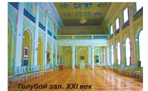
Голубой зал. XXI век

кинотеатр, кружки, которые не закрывались даже в блокадные годы. Затем он был переименован в ДК «Гавань».