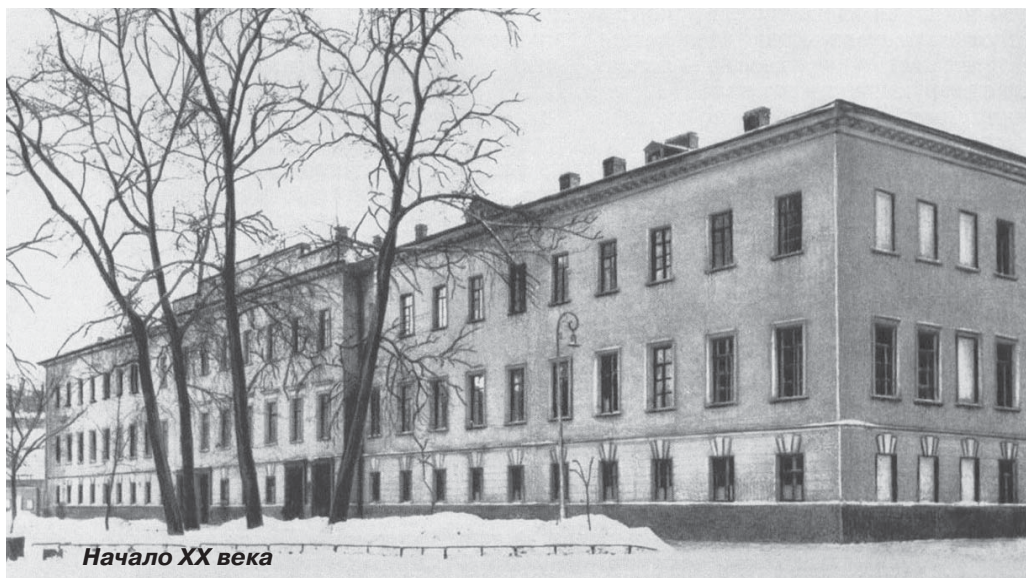
Начало XX века