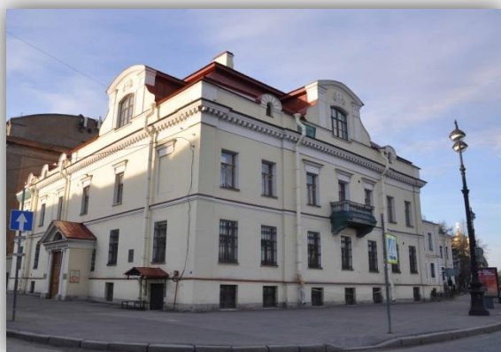
Дом Боткина. Набережная Лейтенанта Шмидта, дом 41