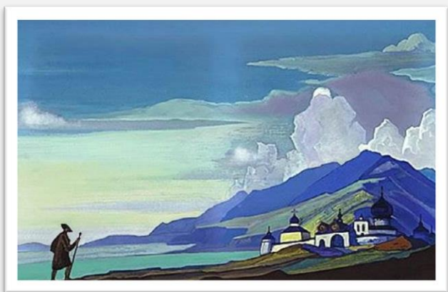
Рерих Н. К. Странник. 1933 год