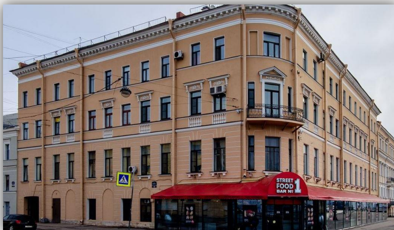
Университетская набережная, дом 25