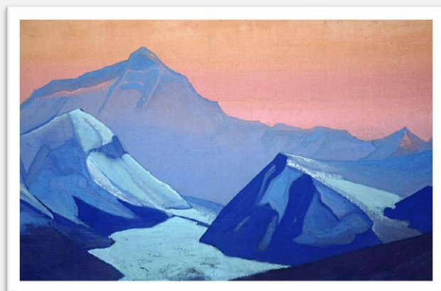
Рерих Н. К. Эверест. 1939 год