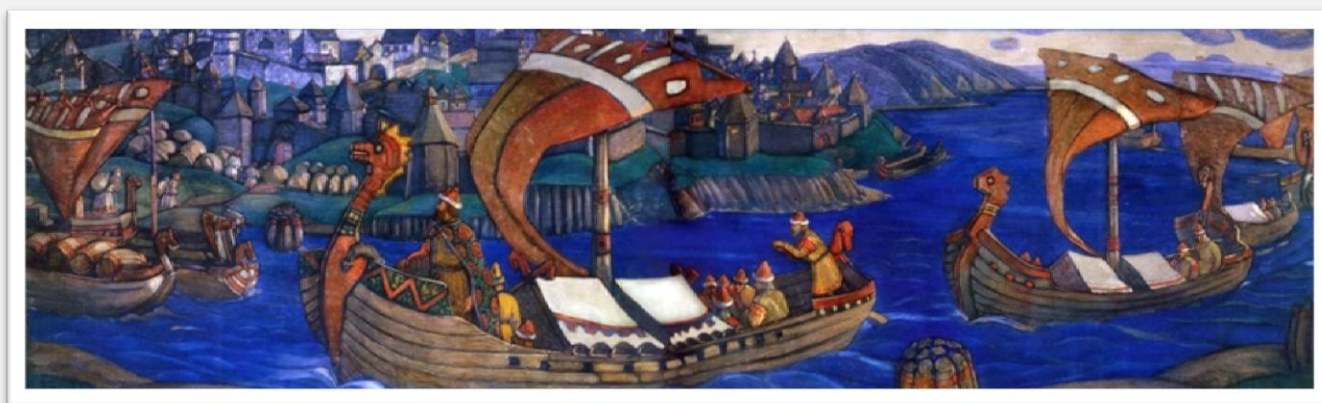
Рерих Н. К. Садко. Декоративное панно. 1910 год