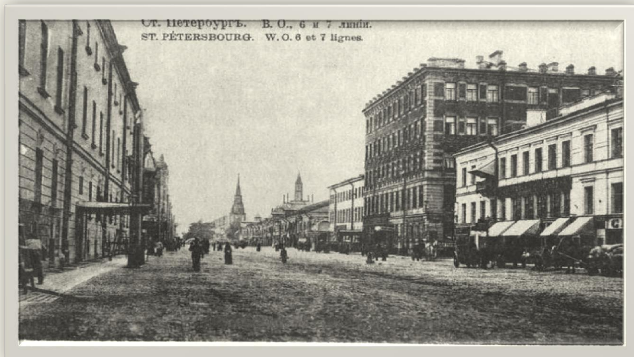
Вид на 6-ю и 7-ю линии. Слева – «Дом Академиков». Фото начала XX века

Ивану Петровичу было уже за семьдесят. После революции в городе царили голод и разруха. И частые обыски не обошли семью ученого. Но, несмотря ни на что, он продолжал активно работать – читал лекции по физиологии, ставил опыты в своей лаборатории. «Павлов проводит поразительные по своему размаху и виртуозности исследования высшей нервной деятельности животных... - в старом пальто, в кабинете, заваленном картофелем и морковью, которые он выращивал в свободное время» - поделился своими впечатлениями английский писатель Герберт Уэллс, посетивший Россию в 1920 году. Многокилометровый путь на работу и обратно Павлов обычно проделывал пешком, так как трамваи ходили крайне редко и были переполнены. Особенно тяжело было зимой идти в темноте по сугробам.