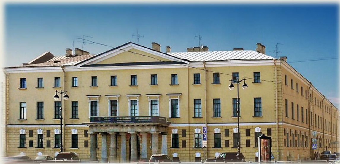
«Дом Академиков». Современное фото

Участок дома №1 на набережной Лейтенанта Шмидта был впервые застроен в 1720-х годах. Здесь находились два типовых дома проекта Д. Трезини. В 1750-х годах оба участка были выкуплены Академией наук, и по проекту С. И. Чевакинского два здания объединили в одно. Здесь разместились типография, анатомический театр Академии наук, жилые квартиры. Спустя некоторое время этот дом у петербуржцев получил своё неофициальное название – «Дом Академиков». В 1793-1794 годах для академической гимназии был построен флигель со стороны 7-й линии и Академического переулка. Таким образом, на участке образовался замкнутый внутренний двор. В 1808-1809 годах по проекту А. Д. Захарова дом был перестроен. В таком виде он существует и сейчас.